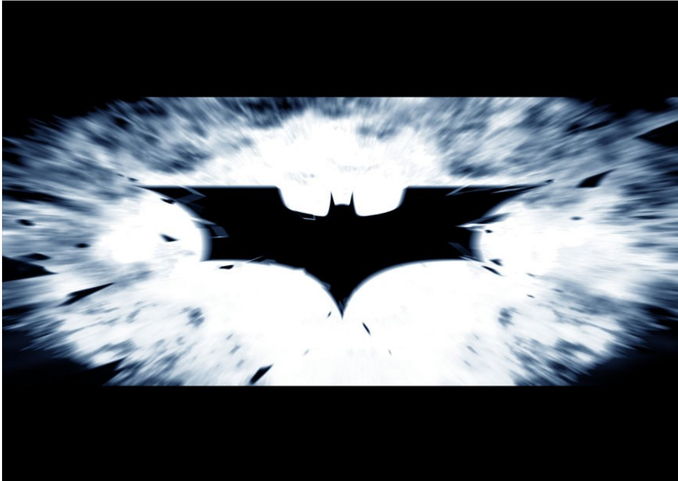
The Dark Knight (2008)